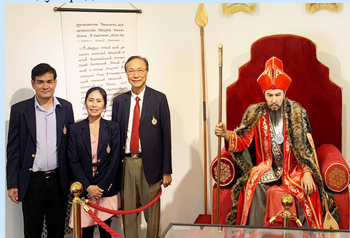
Кафедра Международного бизнеса